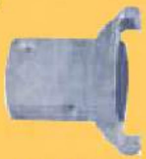
KMF- AB1 KMF- AB2 KMF- AB3