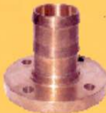
FIXO (150/300 PSI)