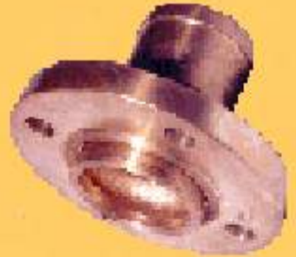
SOLTO (150/300 PSI)