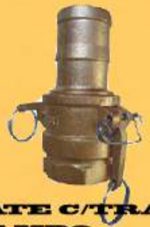
ENGATE C/ TRAVA E GRAMPO