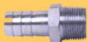
Espiga mangueira macho