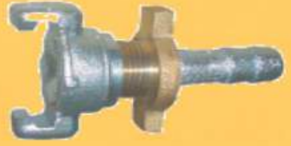
ENGATE COM PORCA DE APERTO

Aplicação: Abrasivos e Ar Material: Alumínio Diâmetros: 3/4", 1", 1 1/4" e 1 1/2" Rosca: BSP - outra sob consulta Pressão: 100 PSI