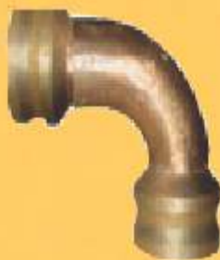
CURVA MACHO/ MACHO