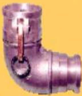
KACP/ KAD 90°