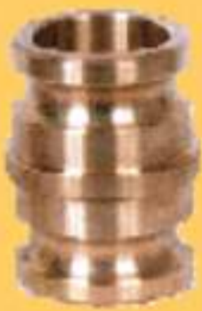
KAD P/ KAD