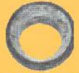
KMF I KMF E KMF M ABRAÇADEIRA VEDAÇÃO