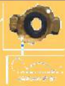
KMF I - T KMF E - T KMF M - T