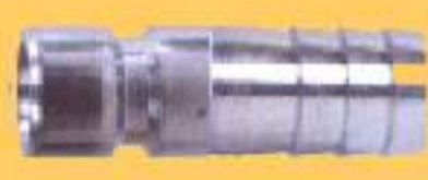
Pino Passagem Livre

SEM RETENÇÃO NO CORPO E NO PINO PASSAGEM LIVRE