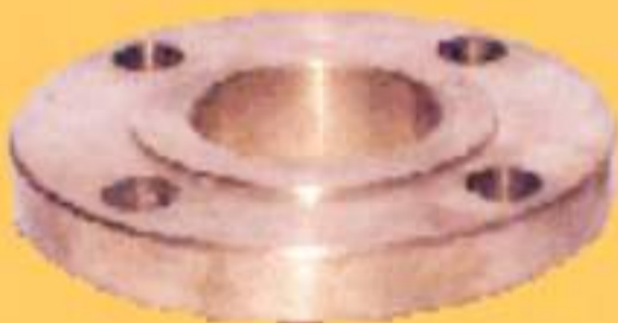
SOLTO (150/300 PSI)