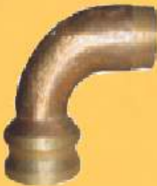
CURVA MACHO/ ROSCA