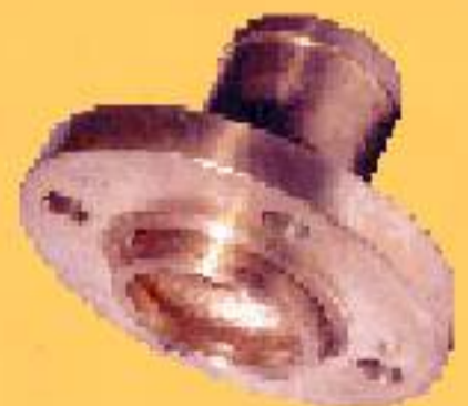
GIRATÓRIO (150/300 PSI)

WWW.KINGCOMERCIAL.COM.BR SKYPE ID: KING.COMERCIAL