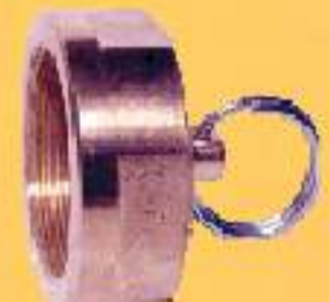
CAPA C/ ROSCA