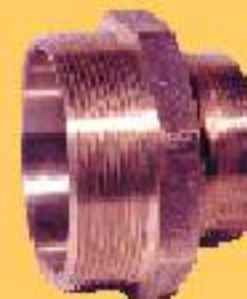
NIPLE DE REDUÇÃO