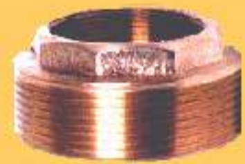
BUCHA DE REDUÇÃO